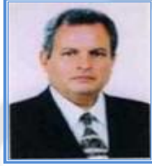
رئيس الجامعة أ.د/ محمود الطيب ناصر